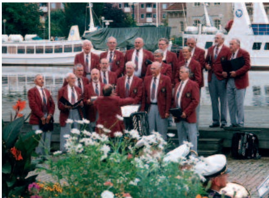
Uddevallavarvets sängkör, en bidragsmottagare med anknytning till Thordénstiftelsens ändamål att bl a främja intressen "som beröra de anställda vid Uddevallavarvet och Sörviksvarvet." Här ett framträdande vid sjösättningen av livräddningskryssaren Gustaf B Thordén.