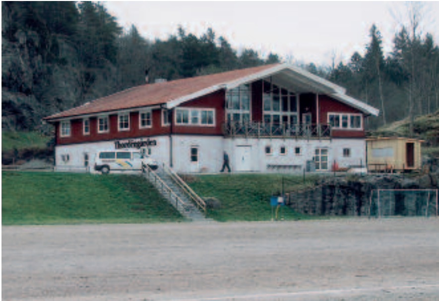
”Thordéngården”, Idrottsklubben Oddevolds klubbhus, tillkommet med bl a betydelsefulla anslag från Thordénstiftelsen.

stiftelses utdelningsmöjligheter också är beroende av hur mycket av inkomsterna som används för uppbyggnad av det egna kapitalet och för omkostnader (se under ”Kapitalförvaltningen” resp ”Administrationen”).